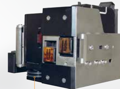
Encoder built-in the printhead for optimal quality of printing