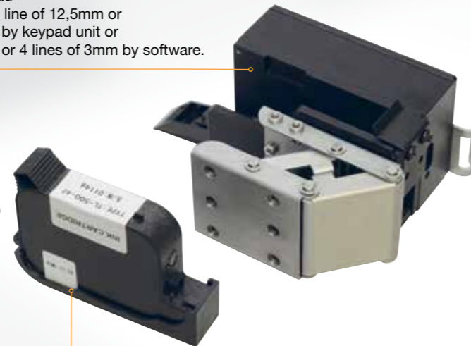
Ink cartridge with tag

K-125 Print head Max text size 1 line of 12,5mm or 2 lines of 6mm by keypad unit or 3 lines of 4mm or 4 lines of 3mm by software.