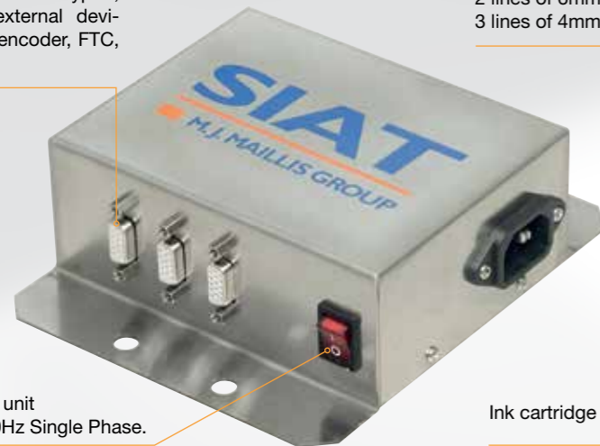
Power supply unit 220-240v - 50Hz Single Phase.

Serial ports for keypad, print head, external devices (such as encoder, FTC, alarm lamp).